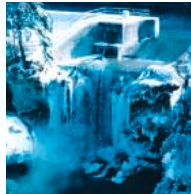
Winterliche Ansicht des Streichwehrs.

Im 15. Jahrhundert konnte der Traunfall zum ersten Mal mit Schiffen und Flößen befahren werden. Beim „Wilden Fall“, wo die Traun über Felsen hinunterstürzt, hatte man am Hang neben dem Traunufer einen ca. 500 Meter langen Kanal aus dem Felsen gesprengt, der unterhalb des Falles wieder in die Traun mündete. Er war vollständig mit Holz ausgekleidet, so daß die Salzschiffe darin talwärts rutschen konnten. Das Wasser für die sogenannte „Floßgasse“ wurde dem Fluß über eine Schleusenanlage oberhalb des Falls entnommen.