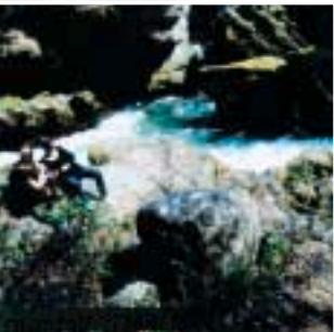
Natur pur: Die wildromantische Landschaft rund um den Traunfall.

Lambach geschafft werden mußte; erst dort konnte es auf die Salzschiffe verladen werden. Dies kostete nicht nur Zeit, es machte den Salztransport auch wesentlich teurer.